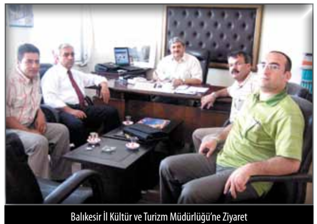
Balıkesir İl Kültür ve Turizm Müdürlüğü'ne Ziyaret