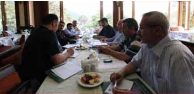
Toplu Görüşme ve Özlük Hakları Komisyonu