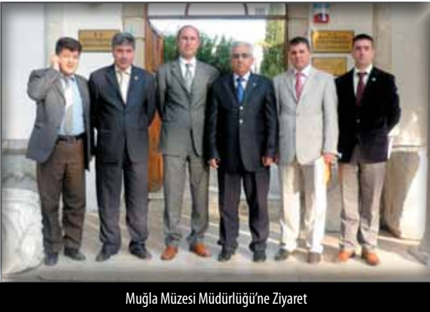
Muğla Müzesi Müdürlüğü'ne Ziyaret