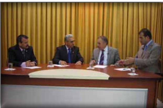
Rize Kaçkar TV'de Programa Katılma