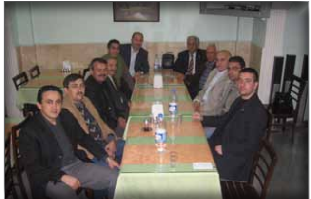
Adana Memur-Sen Temsilciliğimiz