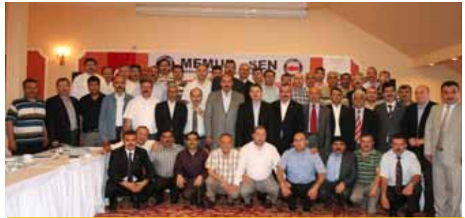
Abant Genel Başkanlar ve Yönetim Kurulu Üyeleri

Başkanlar Kurulu toplantısı, daha sonra açıklanan bildiri ile sona erdi.