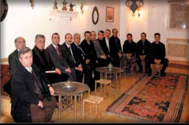
Rölöve Müdürleri Eğitim Semineri Toplantısında Müdürlerimize Yemek