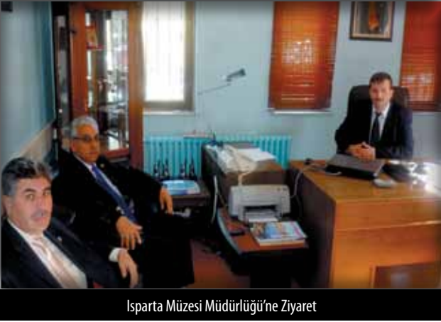
Isparta Müzesi Müdürlüğü'ne Ziyaret