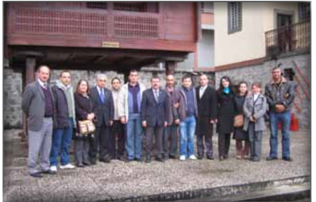
Rize Müze Çalışanlarını Ziyaret