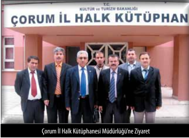
Çorum İl Halk Kütüphanesi Müdürlüğü'ne Ziyaret