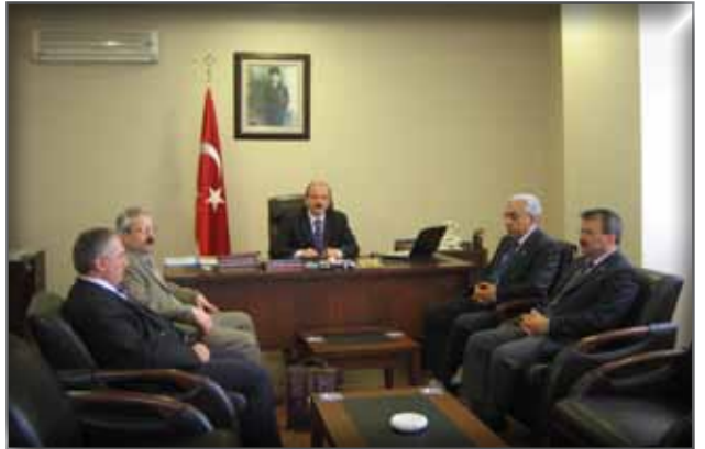
Rize İl Kültür ve Turizm Müdürlüğü'ne Ziyaret