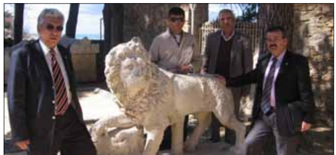
Restorasyon sonrası Aslan Heykeli