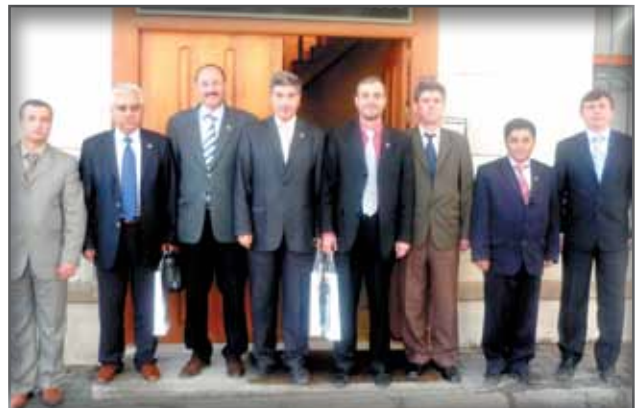
İsparta İl Kültür ve Turizm Müdürü ve Memur-Sen İl Temsilcisi ile