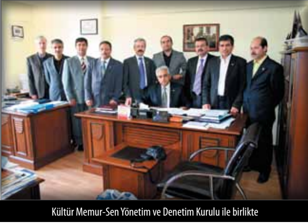
Kültür Memur-Sen Yönetim ve Denetim Kurulu ile birlikte