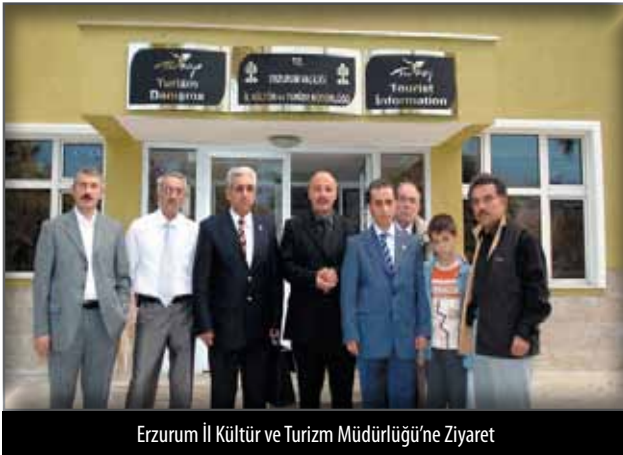
Erzurum İl Kültür ve Turizm Müdürlüğü'ne Ziyaret