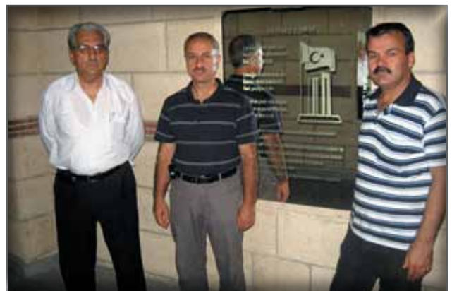
Çanakkale Aynalı Çarşısı