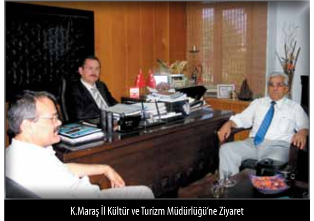
K.Maraş İl Kültür ve Turizm Müdürlüğü'ne Ziyaret