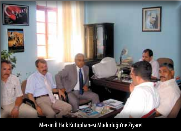
Mersin İl Halk Kütüphanesi Müdürlüğü'ne Ziyaret