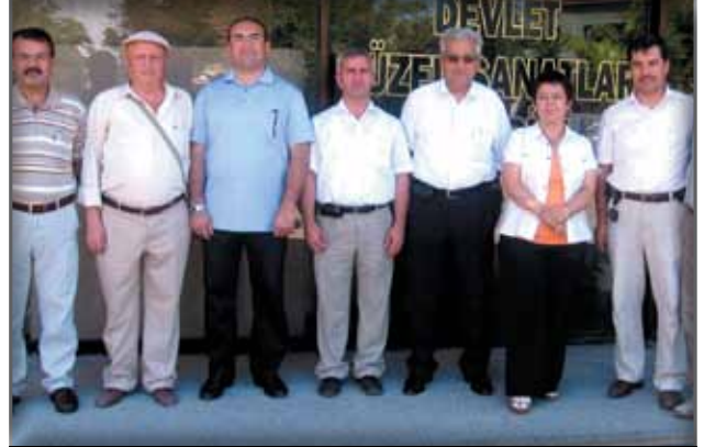
Eskişehir Müzesi Müdürlüğü'ne Ziyaret