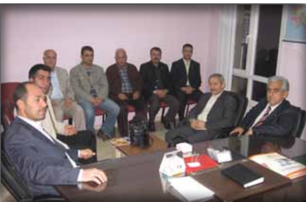
Adana Memursen İl Temsilciliğini Ziyaret