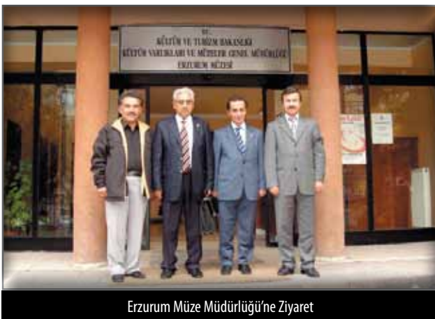
Erzurum Müze Müdürlüğü'ne Ziyaret