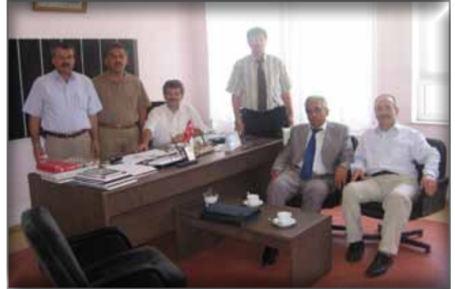
Edirne Kütüphane Müdürlüğüne Ziyaret