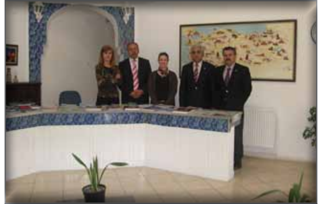
Alanya Turizm Danışma Bürosu Enformasyon Memurları