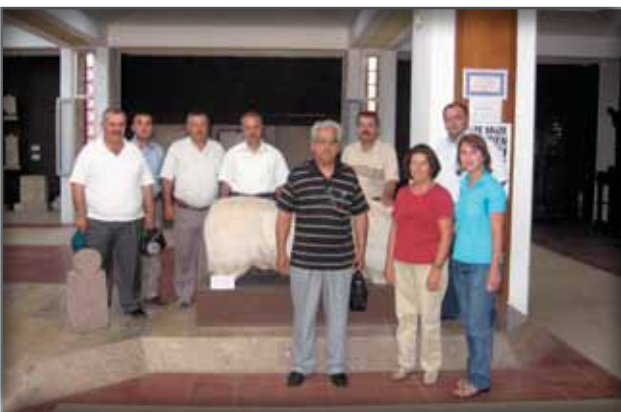
Çanakkale Müzesi Müdürlüğü'ne Ziyaret