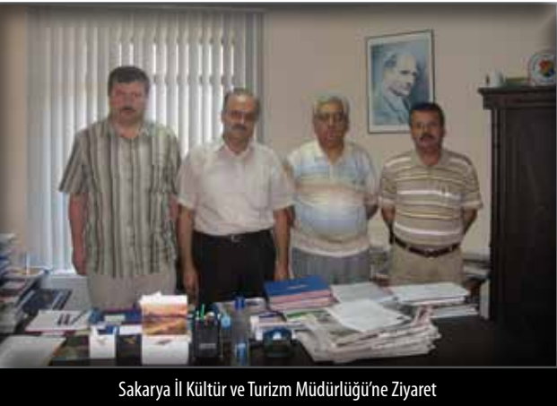
Sakarya İl Kültür ve Turizm Müdürlüğü'ne Ziyaret