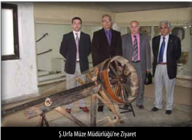
Ş.Urfa Müze Müdürlüğü'ne Ziyaret