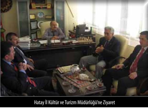
Hatay İl Kültür ve Turizm Müdürlüğü'ne Ziyaret