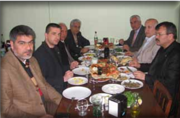
Adana İl Kültür ve Turizm Müdür Vekili ile Bir Toplantı