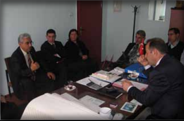
Trabzon İl Halk Kütüphanesi Müdürlüğü'ne Ziyaret