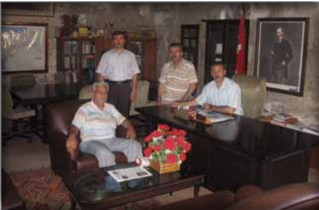
Bitlis İl Kültür ve Turizm Müdürlüğüne Ziyaret