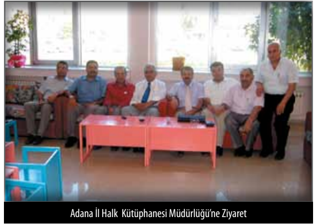
Adana II Halk Kütüphanesi Müdürlüğü'ne Ziyaret