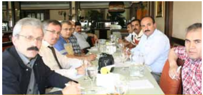
Demokratikleşme, İnsan Hakları, Özgürleşme ve Yeni Anayasa Komisyonu