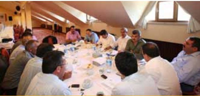
Sendika Siyaset İlişkileri ve Yasama Faaliyetlerine Katılım Stratejisi Belirleme ve Takip Komisyonu