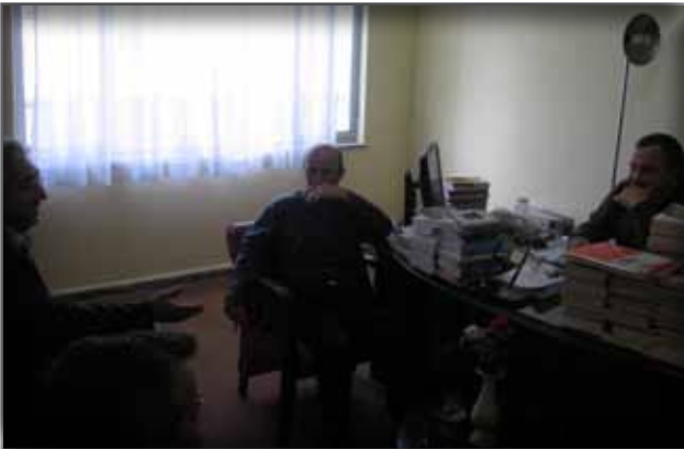
Alanya Kütüphane Müdürlüğü'ne Ziyaret