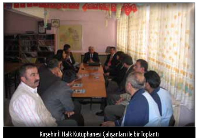
Kırşehir İl Halk Kütüphanesi Çalışanları ile bir Toplantı