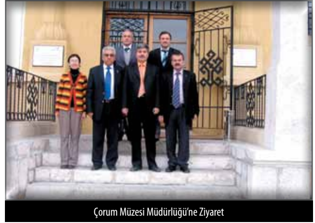
Çorum Müzesi Müdürlüğü'ne Ziyaret