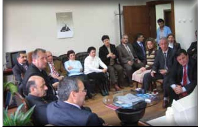
Ordu İl Kültür ve Turizm Müdürlüğü Çalışanlarını Ziyaret