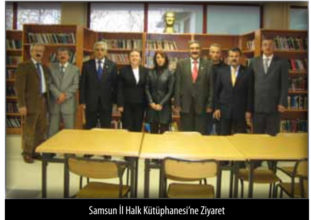
Samsun İl Halk Kütüphanesi'ne Ziyaret