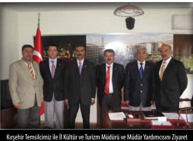
Kırşehir Temsilcimiz ile İl Kültür ve Turizm Müdürü ve Müdür Yardımcısını Ziyaret