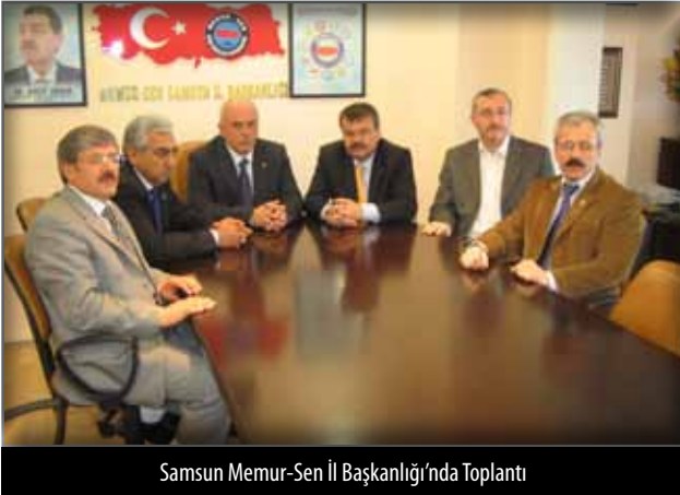
Samsun Memur-Sen İl Başkanlığı'nda Toplantı