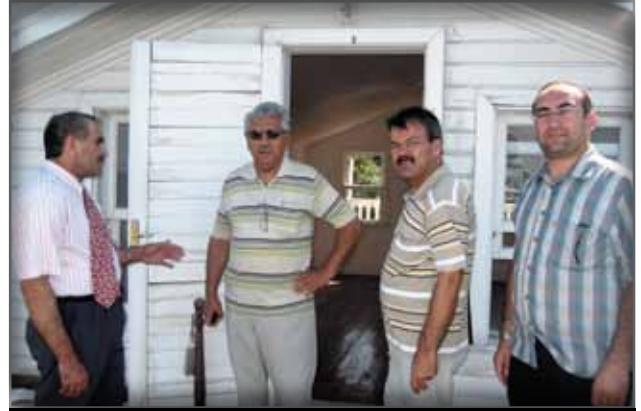
Bursa-Mudanya Mütareke Müzesi'ne Ziyaret