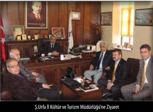
Ş.Urfa İl Kültür ve Turizm Müdürlüğü'ne Ziyaret