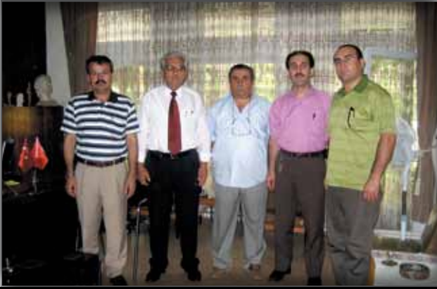
Bursa Müze Müdürlüğü'ne Ziyaret