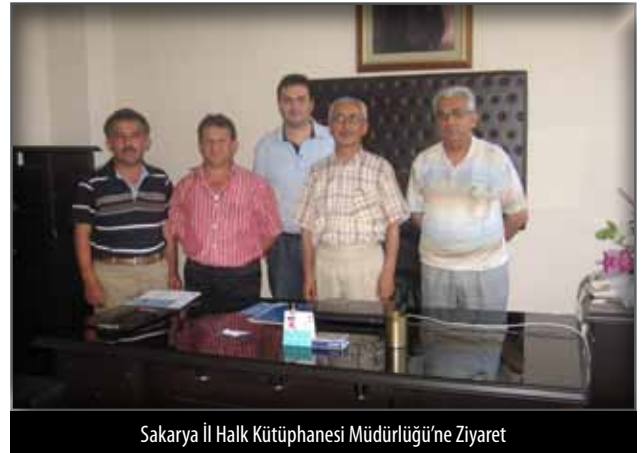
Sakarya İl Halk Kütüphanesi Müdürlüğü'ne Ziyaret