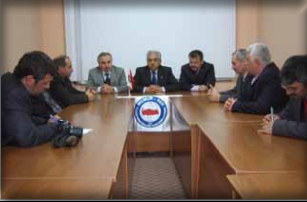
Rize Memur-Sen İl Başkanlığı'nda Basın Toplantısı