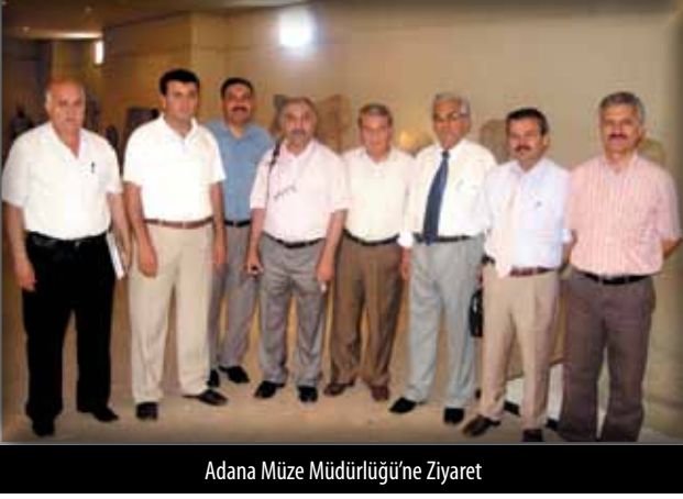
Adana Müze Müdürlüğü'ne Ziyaret