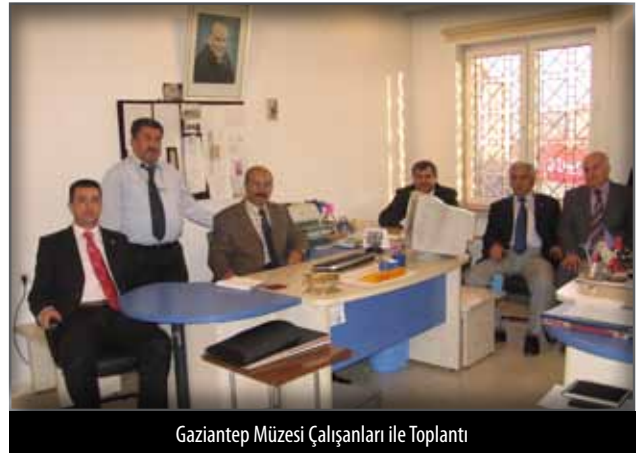
Gaziantep Müzesi Çalışanları ile Toplantı