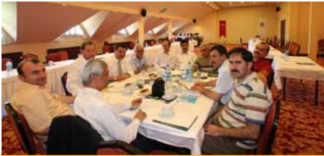
Kurumsal İlkeler, Aidiyet Duygusu, Medeniyet ve Kültür Değerlerimizin Sendikacılığa Taşınması Komisyonu