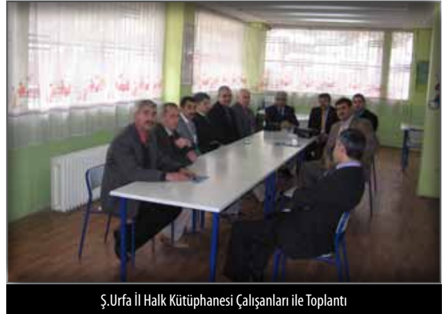
Ş.Urfa İl Halk Kütüphanesi Çalışanları ile Toplantı