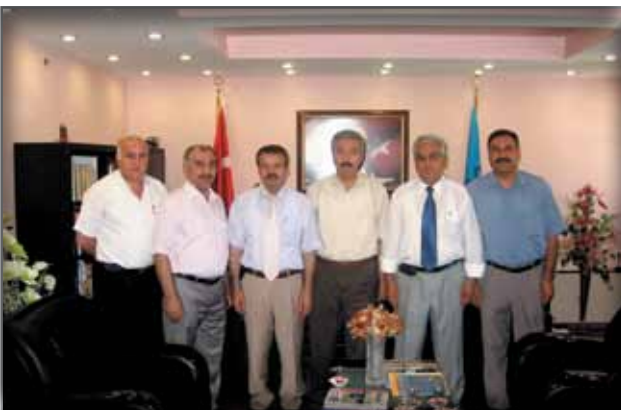
Adana İl Kültür ve Turizm Müdürlüğüne Ziyaret