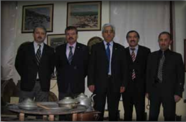
Ordu Güzel Sanatlar Galerisini Ziyaret