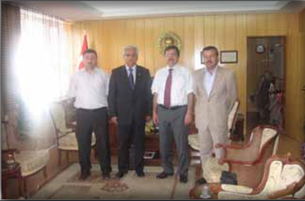
Bitlis Valisini Ziyaret