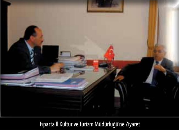
Isparta İl Kültür ve Turizm Müdürlüğü'ne Ziyaret