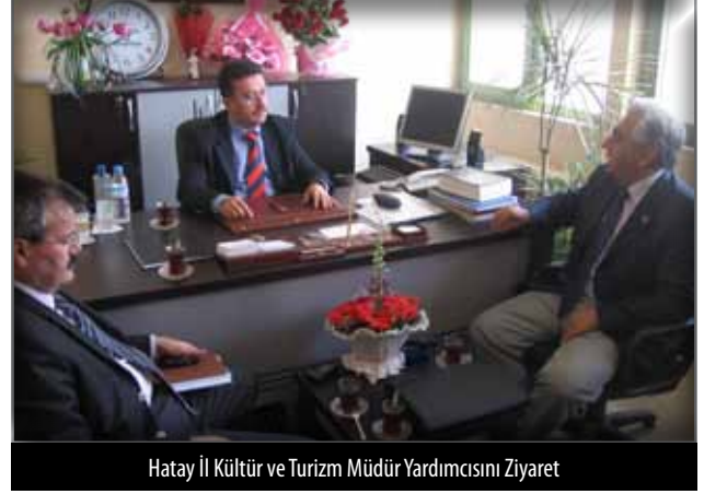
Hatay İl Kültür ve Turizm Müdür Yardımcısını Ziyaret