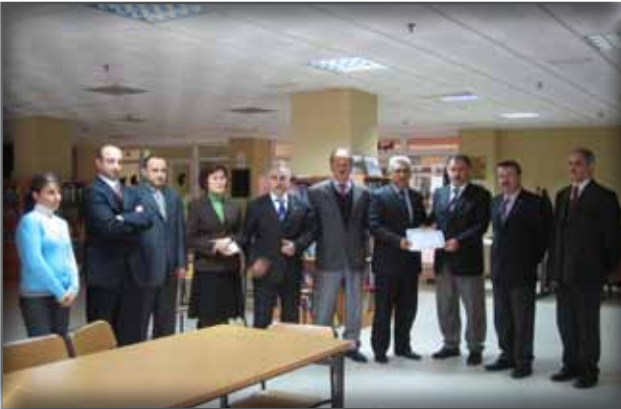
Rize İl Halk Kütüphanesi Müdürlüğü'ne Ziyaret