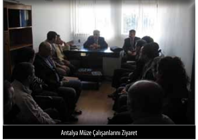
Antalya Müze Çalışanlarını Ziyaret