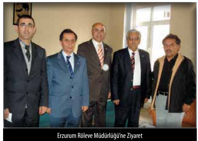
Erzurum Röleve Müdürlüğü'ne Ziyaret