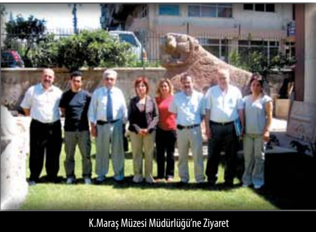
K.Maraş Müzesi Müdürlüğü'ne Ziyaret