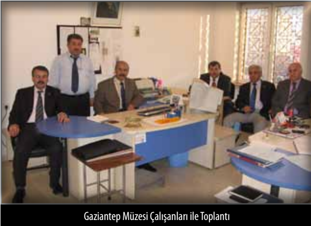
Gaziantep Müzesi Çalışanları ile Toplantı