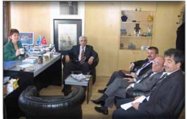
Antalya İl Kültür ve Turizm Müdür Yardımcılarını Ziyaret