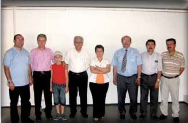
Eskişehir Müze Çalışanları ve İl Temsilcisi'ne Ziyaret