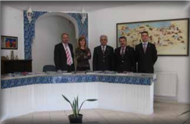
Alanya Turizm Danışma Bürosu Enformasyon Memurları