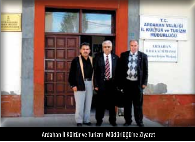
Ardahan İl Kültür ve Turizm Müdürlüğü'ne Ziyaret