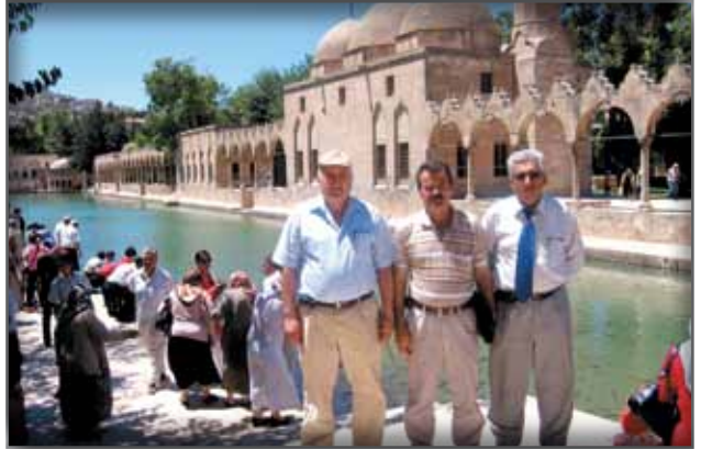
Ş.Urfa Balıklı Göl