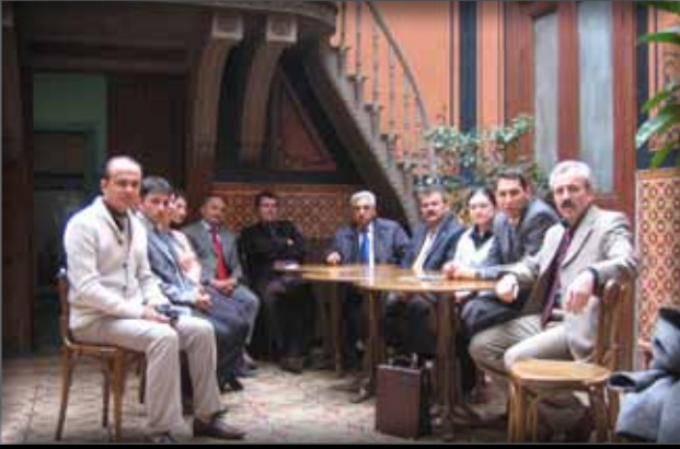
Trabzon Müzesi Çalışanlarını Ziyaret