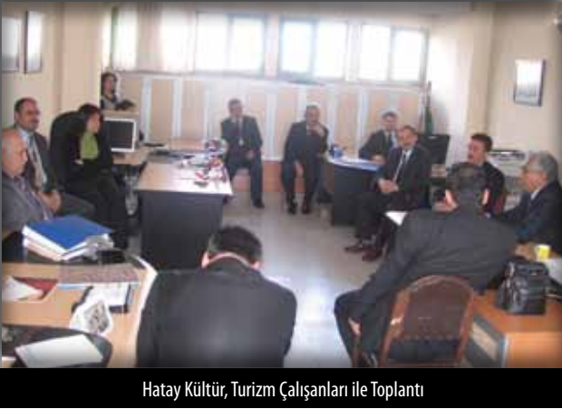
Hatay Kültür, Turizm Çalışanları ile Toplantı