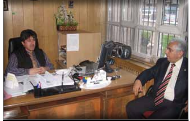
Afyon Müze Müdürlüğü'ne Ziyaret