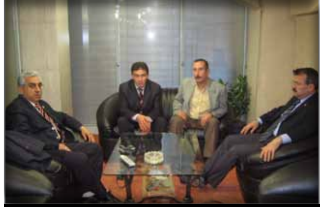
Trabzon Tiyatrosu İdari Müdürlüğü'ne Ziyaret