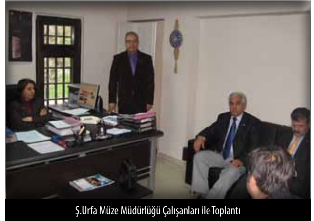
Ş.Urfa Müze Müdürlüğü Çalışanları ile Toplantı