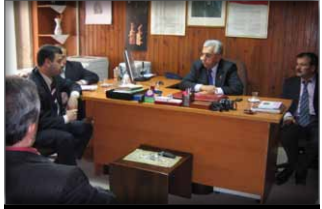
Ordu Müze Müdürlüğü'ne Ziyaret