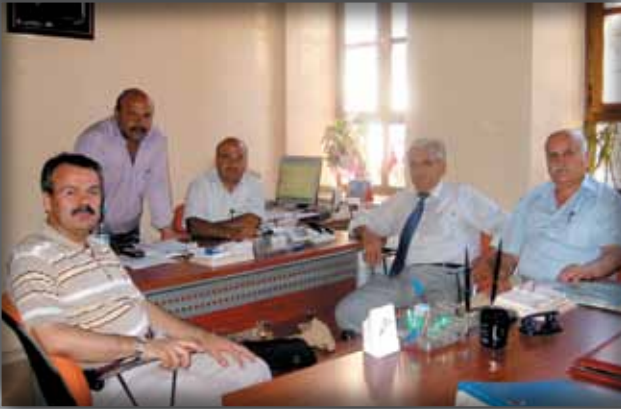
Ş.Urfa İl Kültür ve Turizm Müdürlüğü'ne Ziyaret