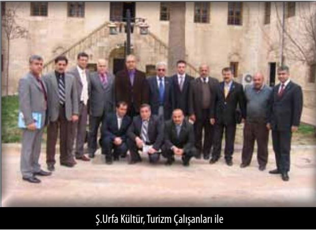
Ş.Urfa Kültür, Turizm Çalışanları ile