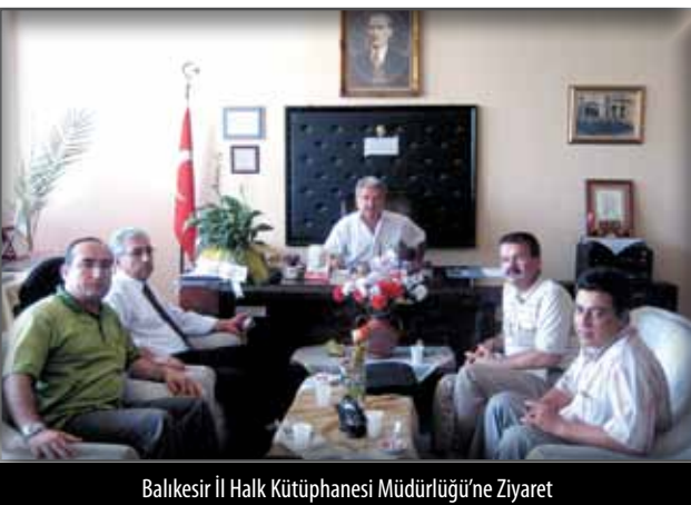
Balıkesir İl Halk Kütüphanesi Müdürlüğü'ne Ziyaret