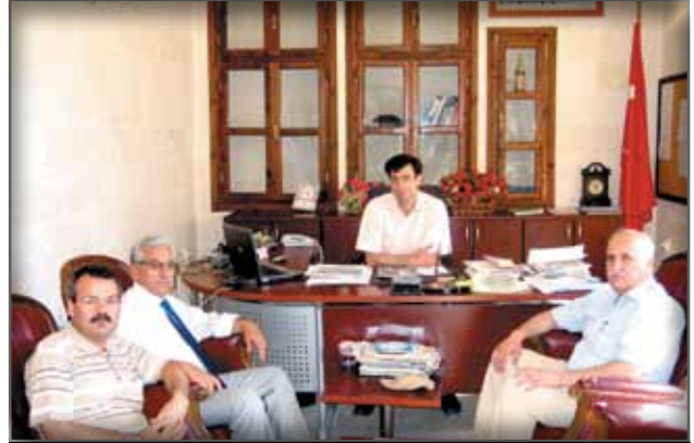
Ş.Urfa Koruma Kurulu Bölge Müdürlüğü'ne Ziyaret