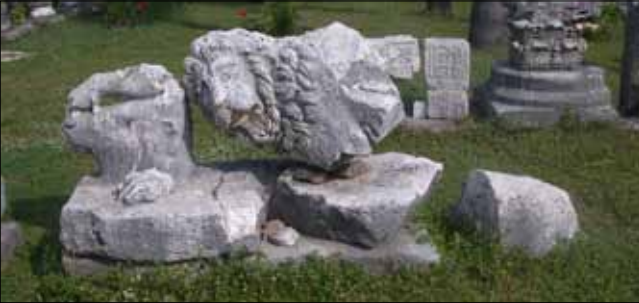
Kaidenin krom çelik pimlerle desteklenmesi

Side Müzesinin restoretörü bulunmadığından eser restorasyonları İstanbul Restorasyon ve Konservasyon Merkez Laboratuvarı denetiminde restorasyon ustası Beyzade YAYCIOĞLU tarafından yürütülmektedir. Beyzade YAYCIOĞLU 2004 yılından bugüne kadar Side Müzesi Envanterindeki 120 adet heykeltıraşlık eserinin restorasyonunu başarı ile tamamlamış, bilgi ve birikimini arkeoloji ve restorasyon bölümü öğrencileri ile paylaşarak, uygulamalı derslerle yetişmelerine katkı sağlamaktadır.