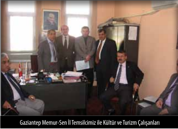
Gaziantep Memur-Sen İl Temsilcimiz ile Kültür ve Turizm Çalışanları