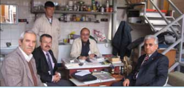
Side Müzesi Restorasyon Atölyesi