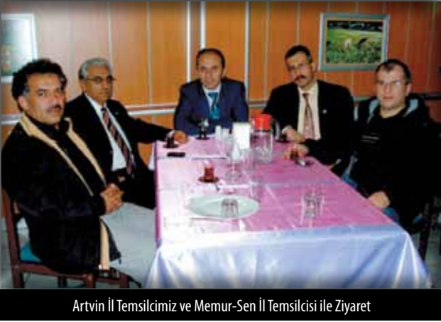
Artvin İl Temsilcimiz ve Memur-Sen İl Temsilcisi ile Ziyaret