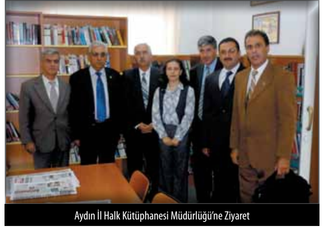
Aydın II Halk Kütüphanesi Müdürlüğü'ne Ziyaret