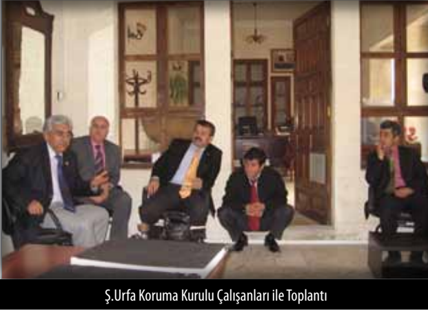
Ş.Urfa Koruma Kurulu Çalışanları ile Toplantı