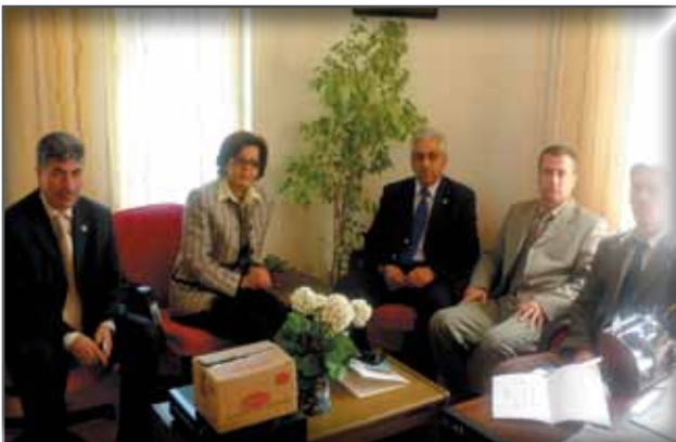
İsparta İl Halk Kütüphanesi Müdürlüğü'ne Ziyaret