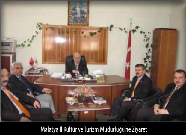
Malatya İl Kültür ve Turizm Müdürlüğü'ne Ziyaret