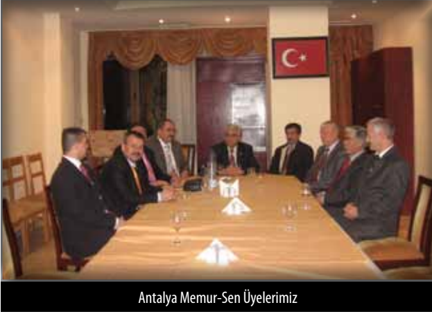
Antalya Memur-Sen Üyelerimiz