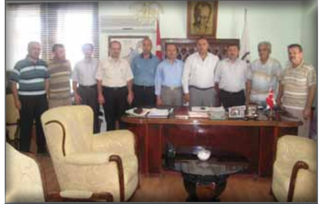
Bitlis Belediye Başkanı'na Ziyaret