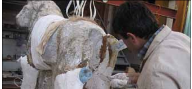
Eksik bölümlerin kalıp alınarak tamamlanması

rektiren bu bozulmalar için 2003 yılında arayışa girilmiş, bu amaçla 1960'lı yıllarda Side Tapınaklarının restorasyonlarında görev alan Alman Heykeltıraş Dietmar Frise ile temasa geçilmiştir. Müze olarak kullanılan Agora Hamamının üstü açık soğukluk bölümünde Dietmar Frise'nin gönüllü bilimsel danışmanlığında, Side kazılarında restorasyon konusunda tecrübe kazanmış Beyzade YAYCIOĞLU isimli bir usta ile restorasyon çalışmalarına başlanmıştır. 2005 yılında Müze bahçesine Restorasyon La-