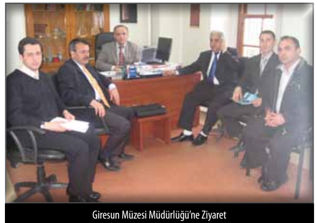
Giresun Müzesi Müdürlüğü'ne Ziyaret