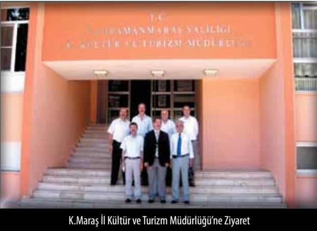
K.Maraş İl Kültür ve Turizm Müdürlüğü'ne Ziyaret