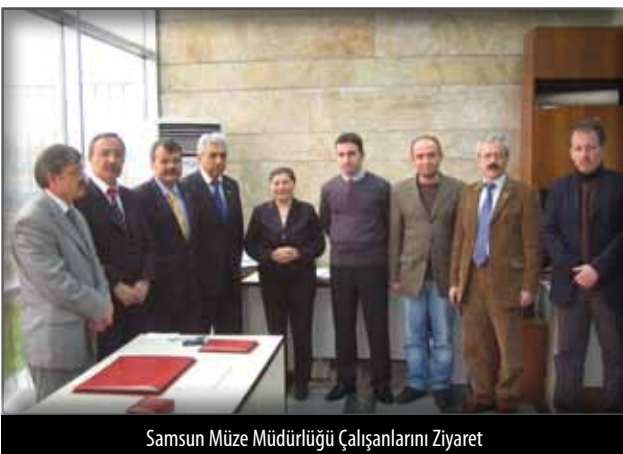
Samsun Müze Müdürlüğü Çalışanlarını Ziyaret