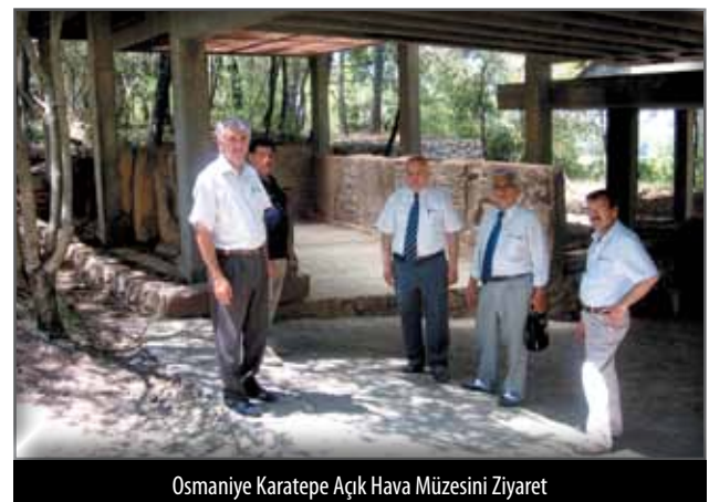
Osmaniye Karatepe Açık Hava Müzesini Ziyaret