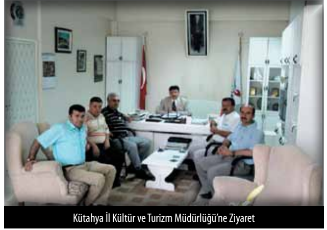
Kütahya İl Kültür ve Turizm Müdürlüğü'ne Ziyaret