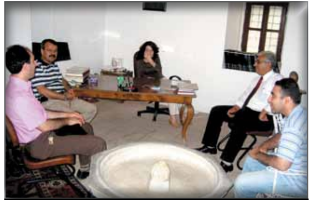
Bursa Türk İslam Eserleri Müzesi Müdürlüğü'ne Ziyaret