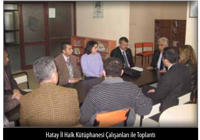
Hatay İl Halk Kütüphanesi Çalışanları ile Toplantı