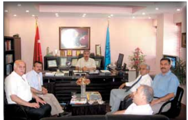
Adana İl Kültür ve Turizm Müdürlüğüne Ziyaret