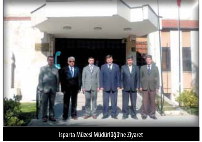
Isparta Müzesi Müdürlüğü'ne Ziyaret