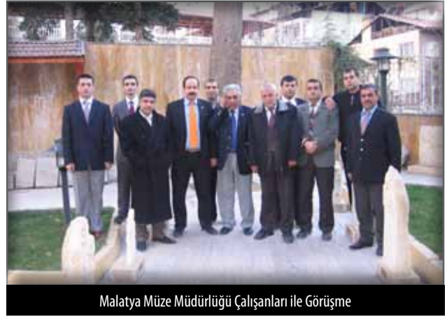
Malatya Müze Müdürlüğü Çalışanları ile Görüşme