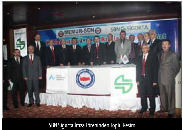
SBN Sigorta İmza Töreninden Toplu Resim