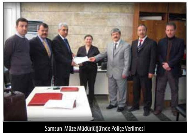
Samsun Müze Müdürlüğü'nde Polişe Verilmesi