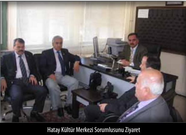
Hatay Kültür Merkezi Sorumlusunu Ziyaret