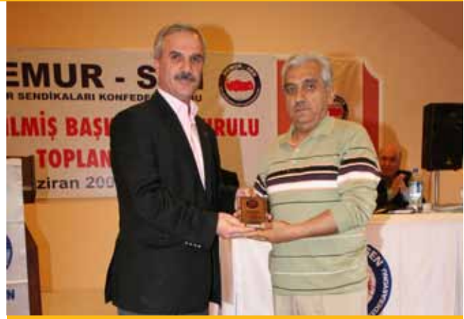
Memur-Sen'den Genel Başkanına Plaket