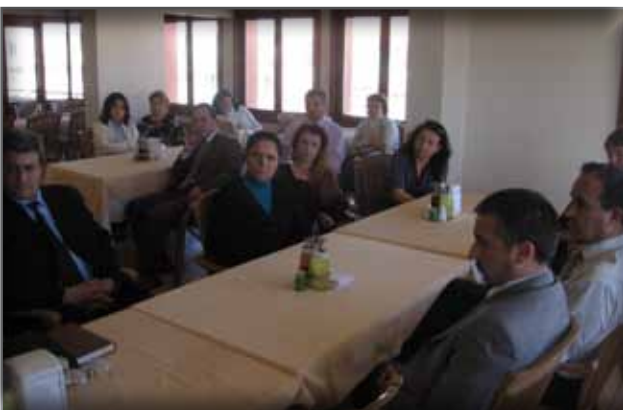
Antalya Kültür, Turizm Çalışanlarını Ziyaret