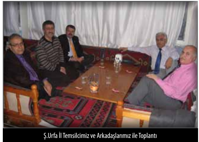
Ş.Urfa İl Temsilcimiz ve Arkadaşlarımız ile Toplantı