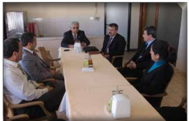
Antalya Kültür, Turizm Çalışanlarını Ziyaret