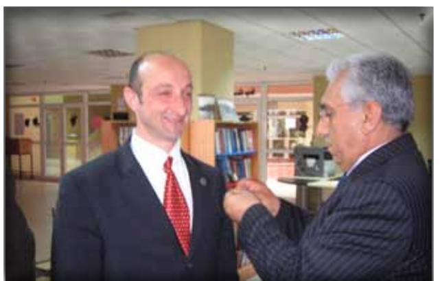
Üyemize Rozet Takarken