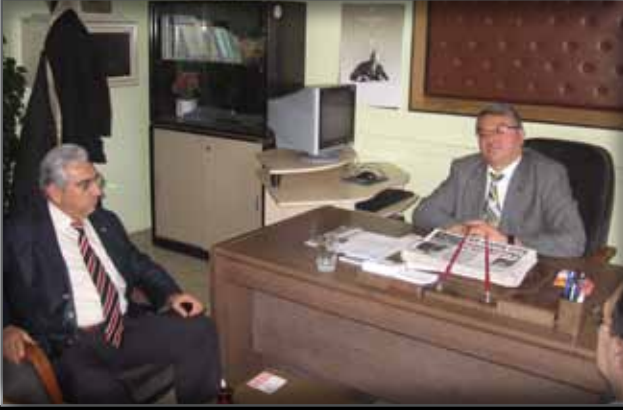
Afyon İl Halk Kütüphanesi Müdürlüğü'ne Ziyaret