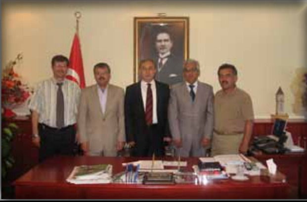
Edirne Valisi Mustafa Büyüğü Ziyaret