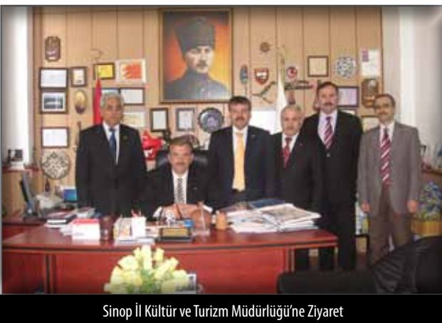
Sinop İl Kültür ve Turizm Müdürlüğü'ne Ziyaret