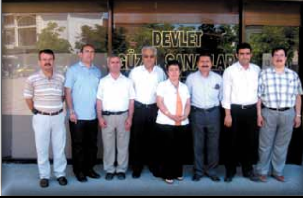
Eskişehir Müze Çalışanlarına Ziyaret