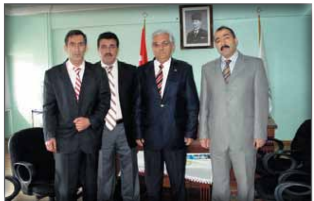
Kars İl Kültür ve Turizm Müdürlüğü'ne Ziyaret