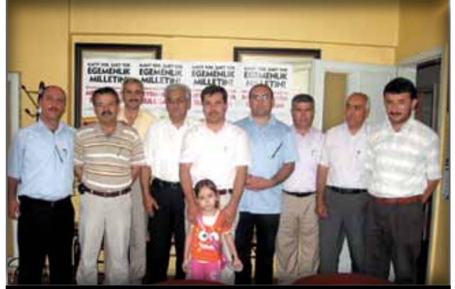
Eskişehir Memur-Sen İl Temsilciliği'ne Ziyaret