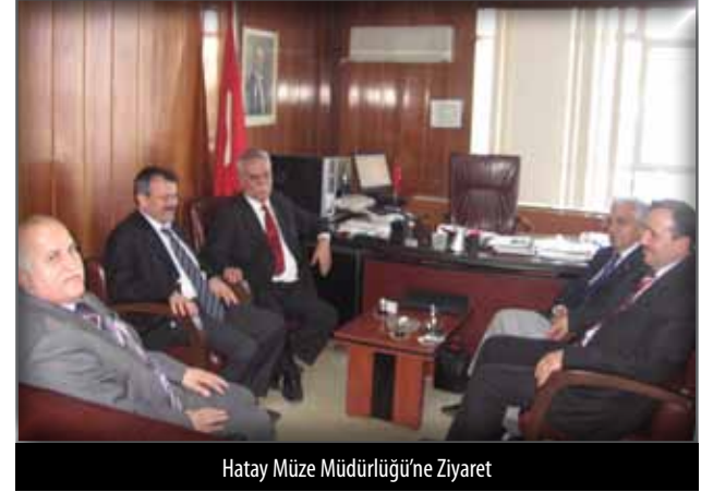
Hatay Müze Müdürlüğü'ne Ziyaret