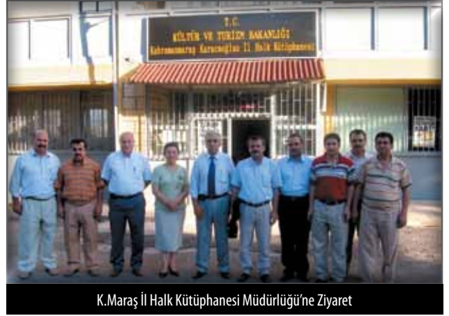
K.Maraş İl Halk Kütüphanesi Müdürlüğü'ne Ziyaret