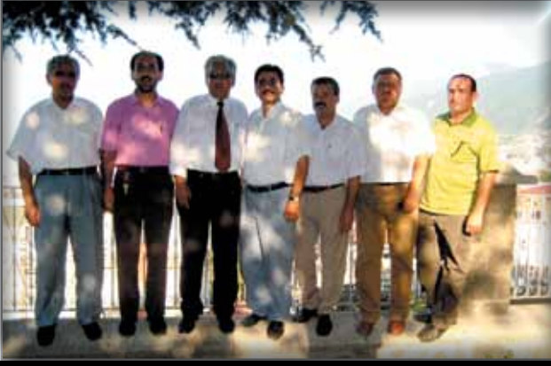
Bursa İl Kültür ve Turizm Müdürlüğü'ne Ziyaret