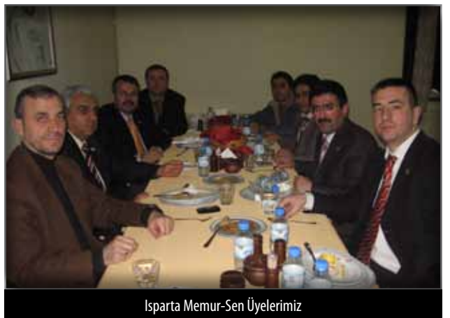
Isparta Memur-Sen Üyelerimiz