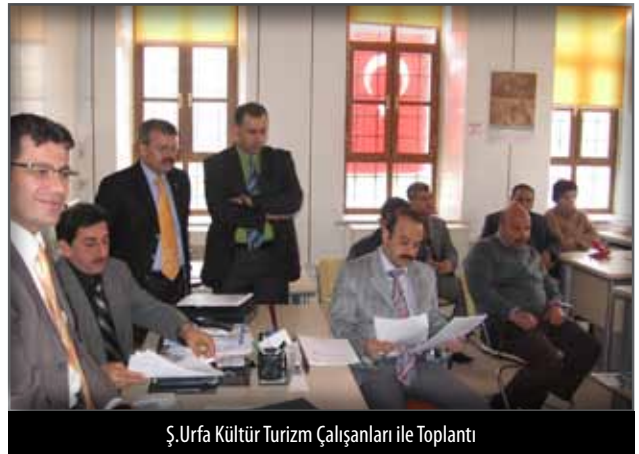
Ş.Urfa Kültür Turizm Çalışanları ile Toplantı