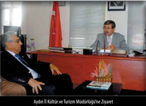
Aydın İl Kültür ve Turizm Müdürlüğü'ne Ziyaret