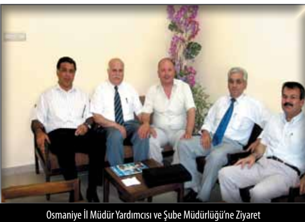
Osmaniye İl Müdür Yardımcısı ve Şube Müdürlüğü'ne Ziyaret