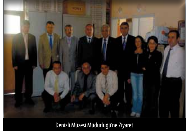
Denizli Müzesi Müdürlüğü'ne Ziyaret