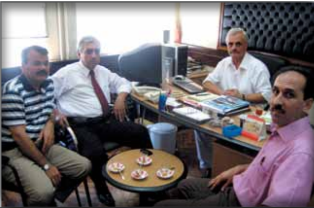
Bursa Tiyatrosu Müdürlüğü'ne Ziyaret