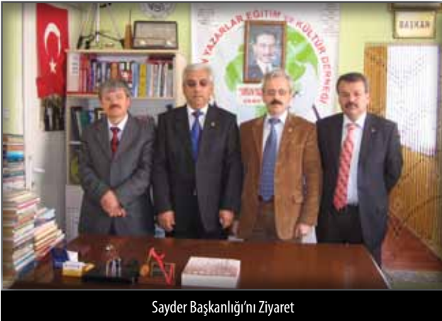
Sayder Başkanlığı'na Ziyaret