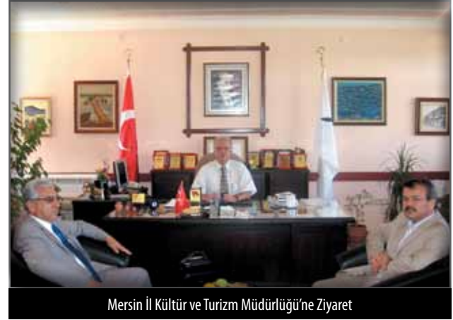
Mersin İl Kültür ve Turizm Müdürlüğü'ne Ziyaret