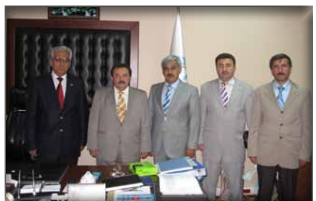
Bitlis Üniversitesi Rektörünü Ziyaret