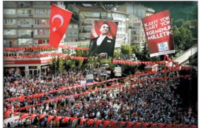
Bursa Ortak Akıl HAREKETİ Mitingi