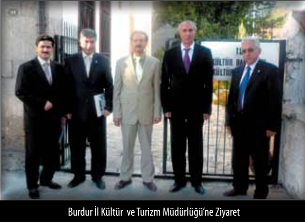
Burdur İl Kültür ve Turizm Müdürlüğü'ne Ziyaret