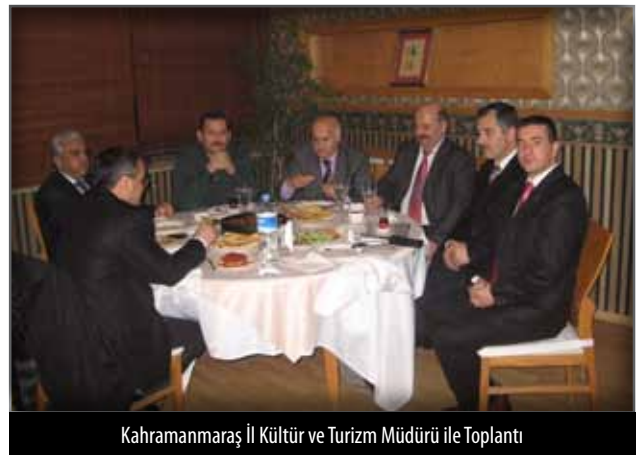
Kahramanmaraş İl Kültür ve Turizm Müdürü ile Toplantı