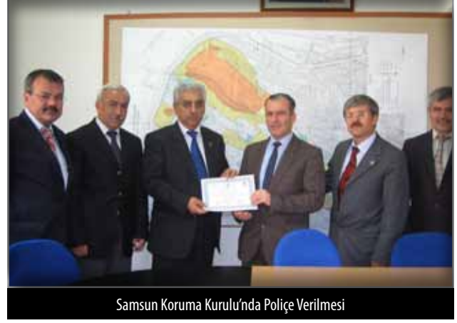
Samsun Koruma Kurulu'nda Polişe Verilmesi