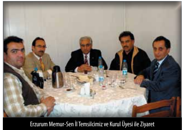
Erzurum Memur-Sen İl Temsilcimiz ve Kurul Üyesi ile Ziyaret