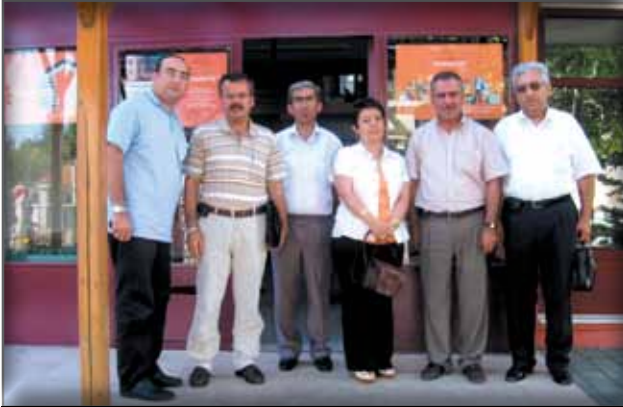
Eskişehir İl Halk Kütüphanesi'ne Ziyaret