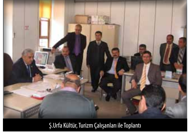
Ş.Urfa Kültür, Turizm Çalışanları ile Toplantı