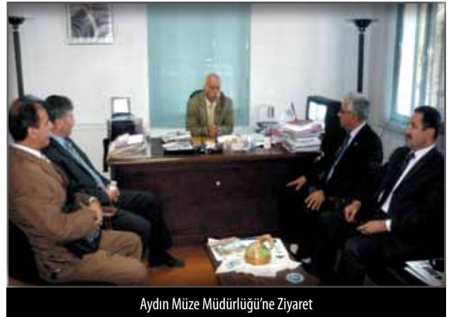
Aydın Müze Müdürlüğü'ne Ziyaret