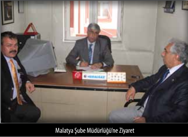
Malatya Şube Müdürlüğü'ne Ziyaret