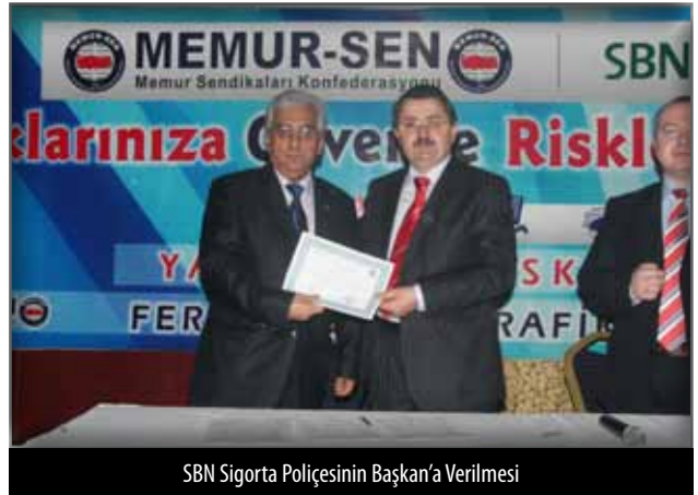
SBN Sigorta Poliçesinin Başkan'a Verilmesi