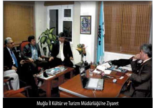
Muğla İl Kültür ve Turizm Müdürlüğü'ne Ziyaret