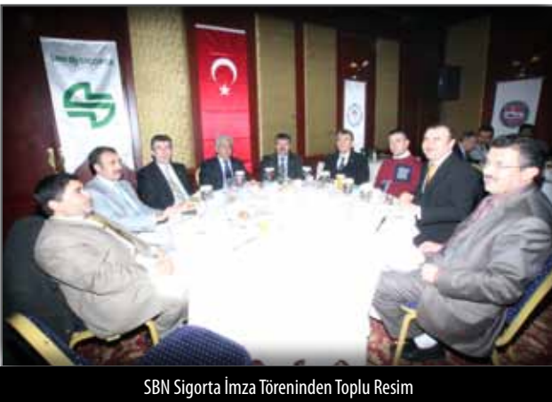
SBN Sigorta İmza Töreninden Toplu Resim