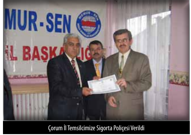
Çorum İl Temsilcimize Sigorta Poliçesi Verildi