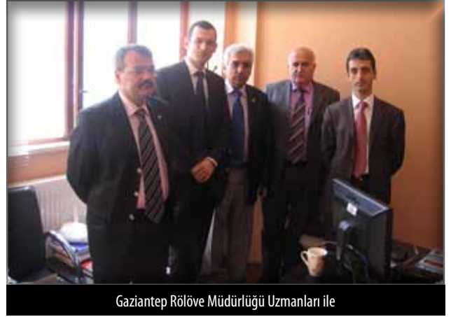
Gaziantep Rölöve Müdürlüğü Uzmanları ile