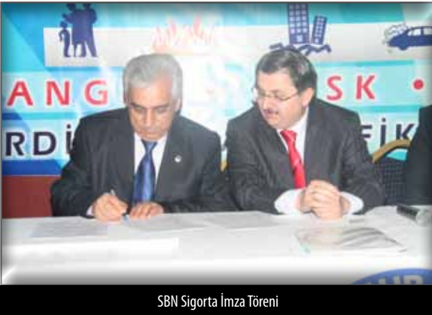
SBN Sigorta İmza Töreni